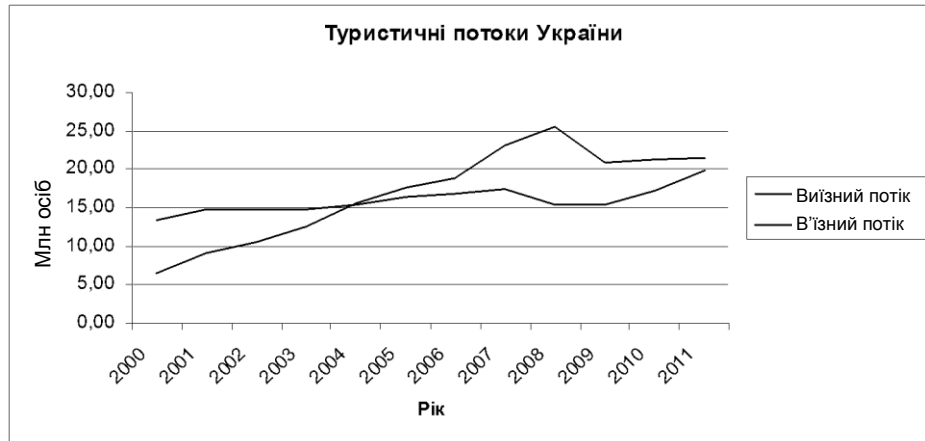
Рис. 3. Динаміка виїзного та в'їзного потоку у структурі міжнародного туризму України за 2000 – 2011 рр., млн осіб [4]

Спираючись на дані Державного комітету статистики України, можна зазначити, що на сьогодні у країні існує певна диспропорція виїзного та в'їзного потоку в структурі міжнародного туризму. У період з 2000 р. до 2007 року в'їзний та виїзний потоки мають тенденцію до поступового збільшення, але у 2008 році тенденція змінилась (рис. 3).