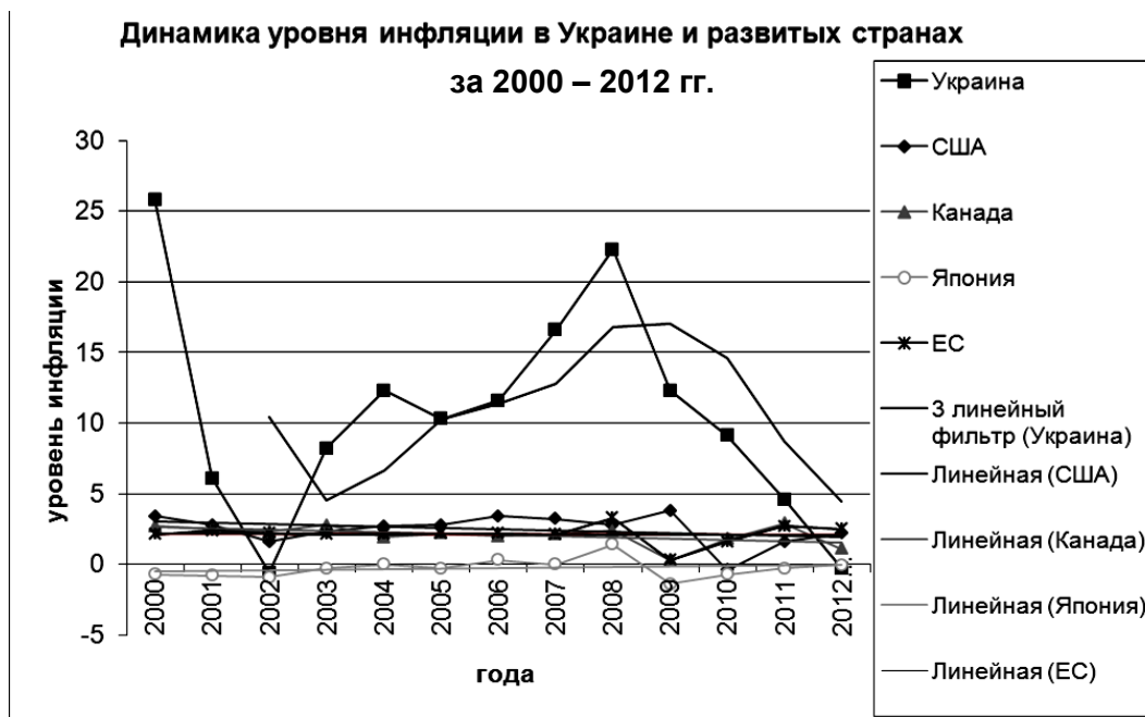
Рис. 1. Динамика уровня инфляции в Украине и развитых странах за 2000 – 2012 гг.

Уровень инфляции в Украине один из самых высоких в мире. Для сравнения в 2009 г. показатель в странах Евросоюза составлял 0,3 %, Японии – -1,4 %, Канаде – 0,3 %, США – 3,8 %, в то же время в Украине – 12,3 %. Но в 2011 г. в Украине уровень инфляции снизился на 7,7 % и стал равен 4,6 %, в странах Евросоюза – 1,6 %, в Канаде – 1,1 %, в США – 1,6 % (рис. 1) [4; 5].