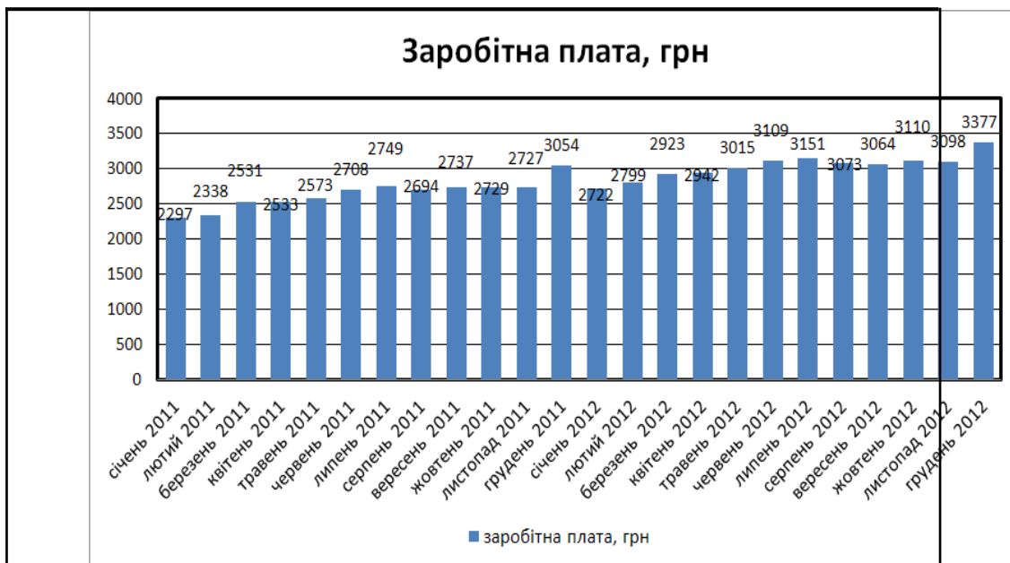
Рис. 1. Співвідношення середньої номінальної заробітної плати за 2011 та 2012 роки

Дані, які наведено на рис. 1, показують, що середня номінальна заробітна плата штатного працівника за 2012 рік становила 3 032 грн, а за 2011 рік складала 2 639 грн. Тобто порівняно з попереднім роком показник середньої номінальної заробітної плати збільшився на 13 %.