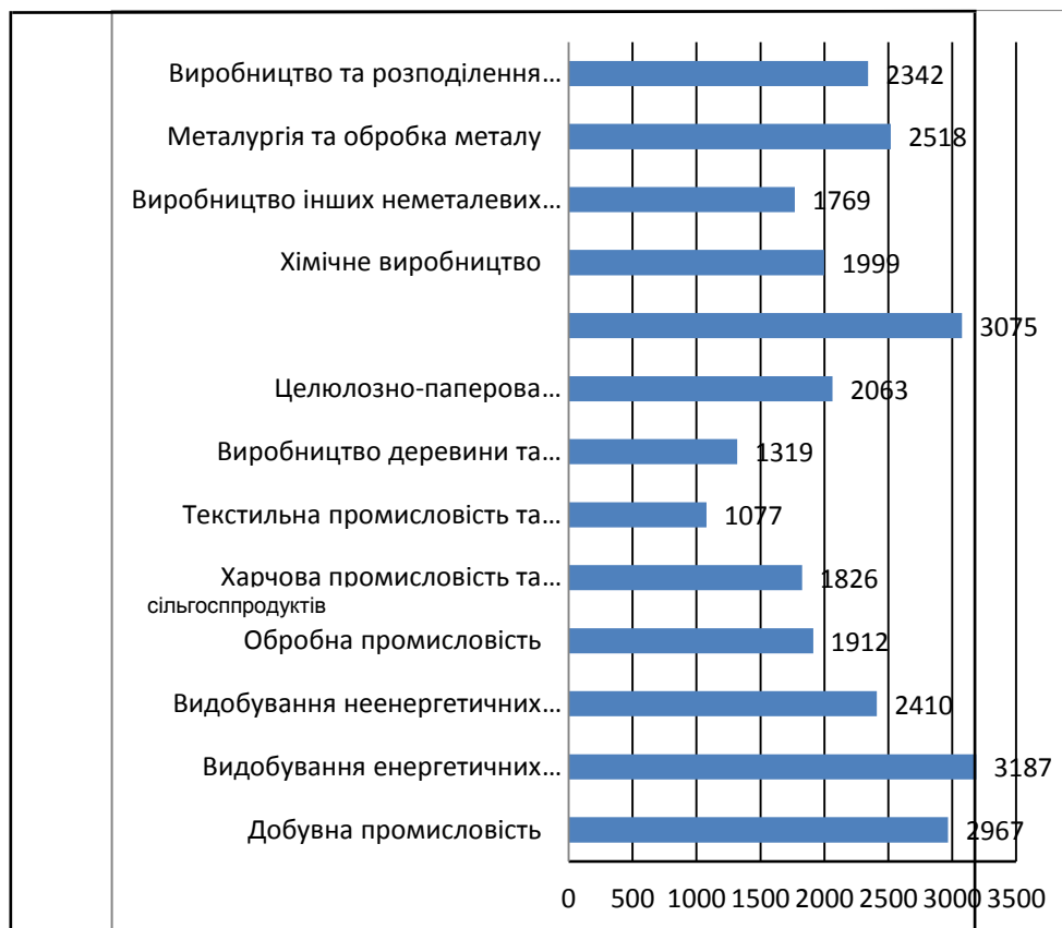
Рис. 2. Заробітна плата штатних працівників за видами промислової діяльності в 2011 році

Найвищі розміри номінальної заробітної плати у 2011 році за видами промислової діяльності спостерігались у працівників, які займаються такими видами промисловості: видобування енергетичних матеріалів (3 187 грн) та виробництво коксу, продуктів нафтопереробки (3 075 грн), що в 1,42 – 1,57 раза перевищує середній рівень заробітної плати за видами промислової діяльності по Україні (рис. 2).