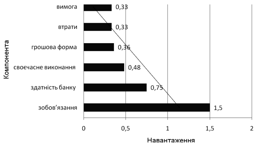
Рис. 1. Результат проведення контент-аналізу поняття "ліквідність"

Якщо проаналізувати дані показники, можна дати такі визначення: "Ліквідність – це здатність банку забезпечити своєчасне виконання своїх зобов'язань без втрат у грошовій формі". Найчастіше ліквідність банку визначається лише як здатність банку виконати свої зобов'язання. Але в сучасних умовах ліквідність банків залежить не лише від незбалансованості активів і пасивів, а й від можливості задовольнити потреби клієнтів у кредитуванні.