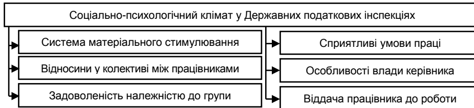
Рис. 1. Фактори, які впливають на соціально-психологічний клімат ДПІУ

Розглянувши запропоновані Паригіним Б. Д. [1] фактори соціально-психологічного клімату у колективі, автором пропонується виділити основні фактори, які можуть впливати на соціально-психологічний клімат у ДПІУ (рис. 1).