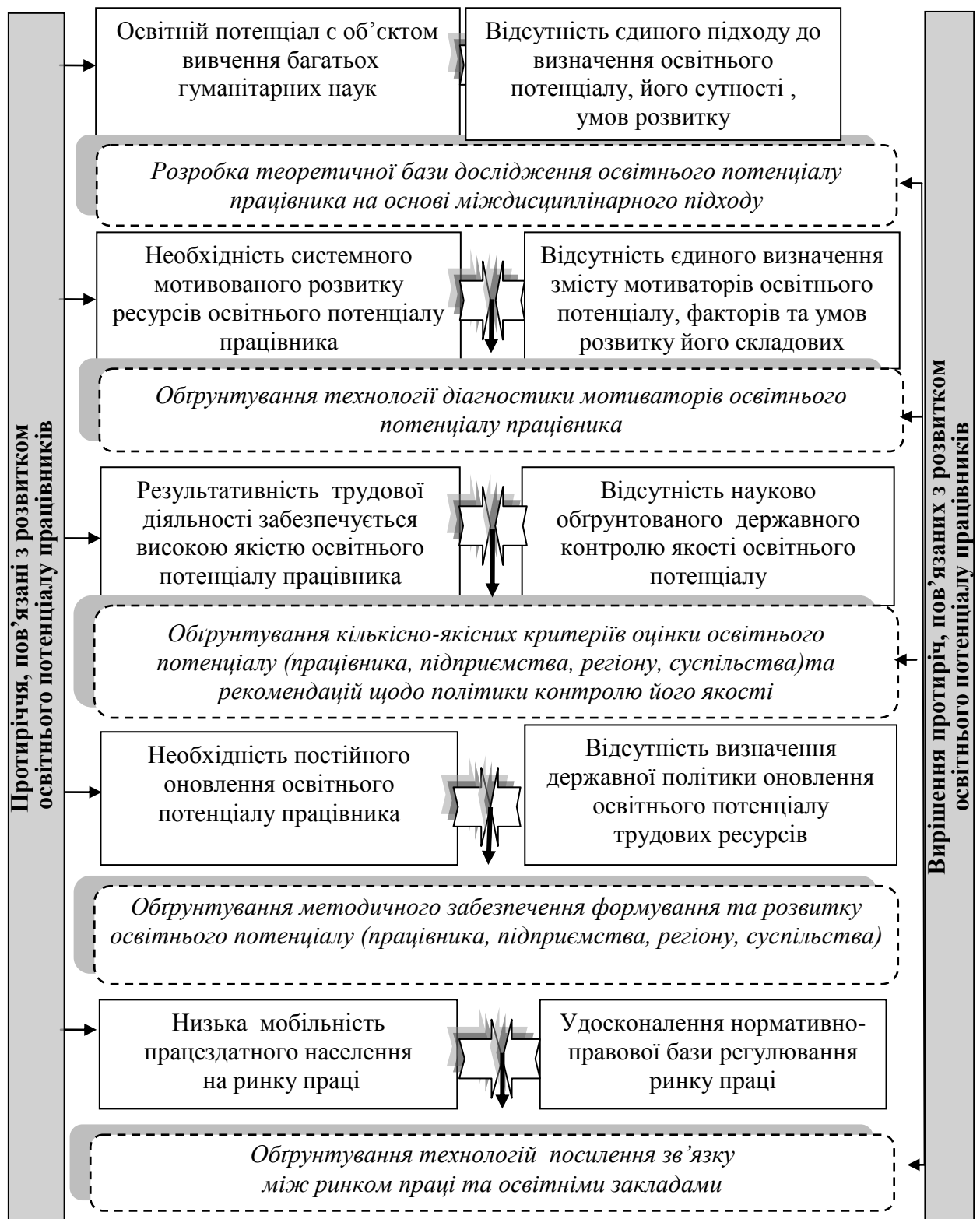
Рис. 1.1. Протиріччя, пов'язані з розвитком освітнього потенціалу працівника в умовах становлення когнітивного суспільства в Україні

Розробка теоретичної бази дослідження освітнього потенціалу працівника на основі міждисциплінарного підходу можлива за рахунок дослідження