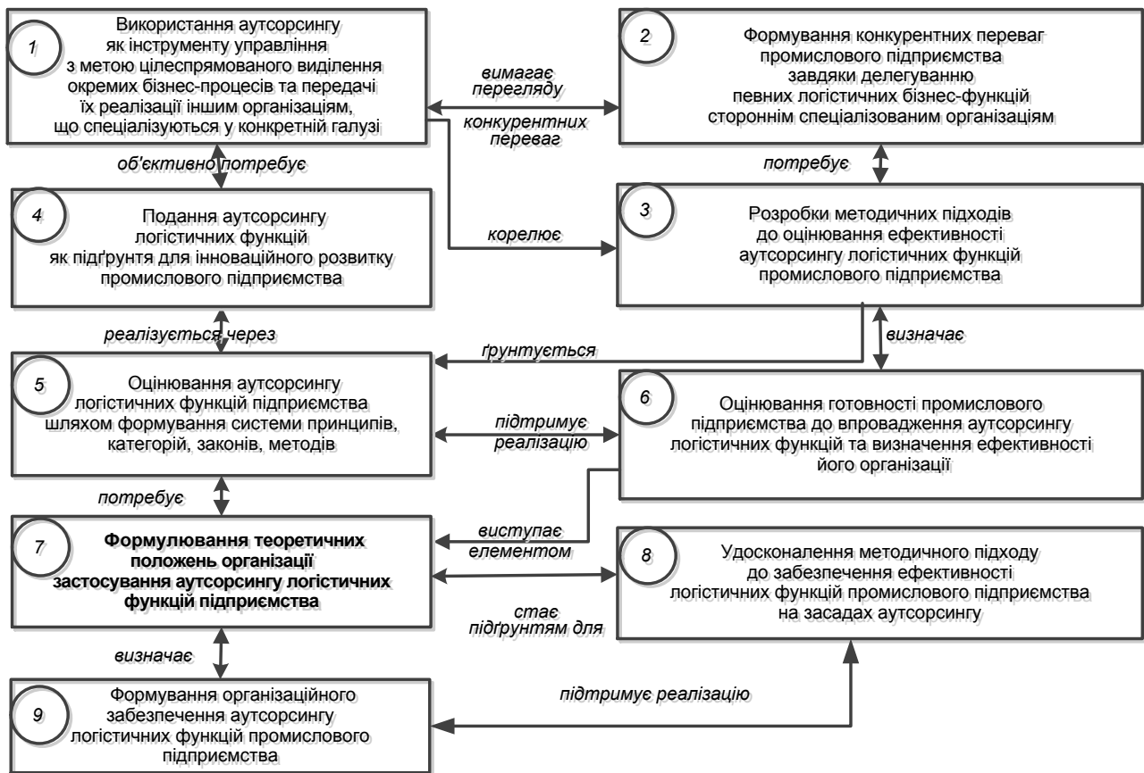
Рис. 2. Логіка процесу забезпечення ефективності аутсорсингу логістичних функцій промислового підприємства

зображеної на рис. 1, у вигляді логіки процесу забезпечення ефективності аутсорсингу логістичних функцій промислового підприємства, як показано на рис. 2.