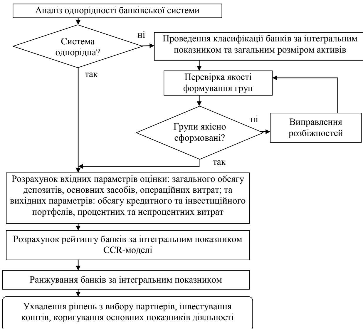
Рис. 1 Логічна послідовність етапів рейтингової оцінки діяльності банків

кредити та депозити розглядаються як вихідні параметри. Такий підхід вимірює ефективність витрат банку, що є необхідним у процесі оцінки діяльності відділень.