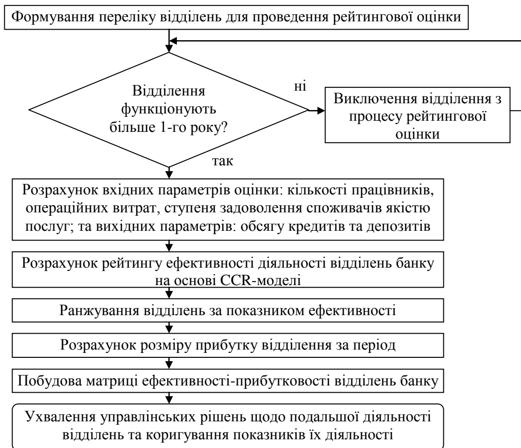
Рис. 4 Логічна послідовність етапів процесу рейтингової оцінки діяльності підрозділів банку

Розробка методичного підходу до рейтингової оцінки діяльності відділень банку дозволила сформувати логічну послідовність етапів процесу оцінки, зображену на рис. 4.