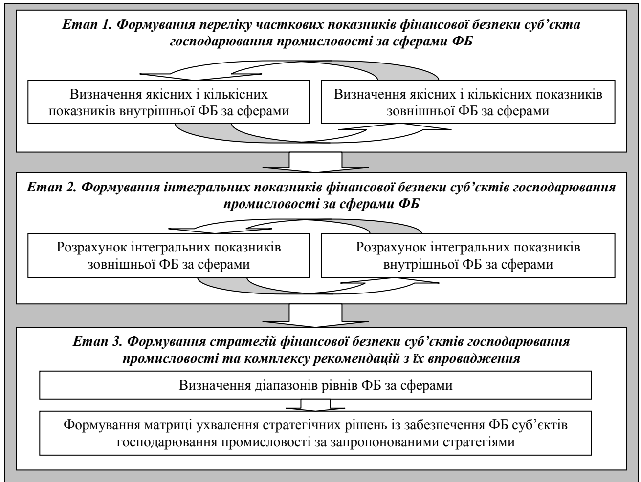
Рис. 2. Послідовність етапів формування стратегій фінансової безпеки суб'єктів господарювання промисловості

стратегії ФБ до змін зовнішнього та внутрішнього фінансового середовища. На основі проведеного аналізу існуючих методичних підходів до визначення стратегій ФБ суб'єктів господарювання промисловості у дисертації обґрунтовано й уточнено послідовність етапів їх формування (рис. 2).