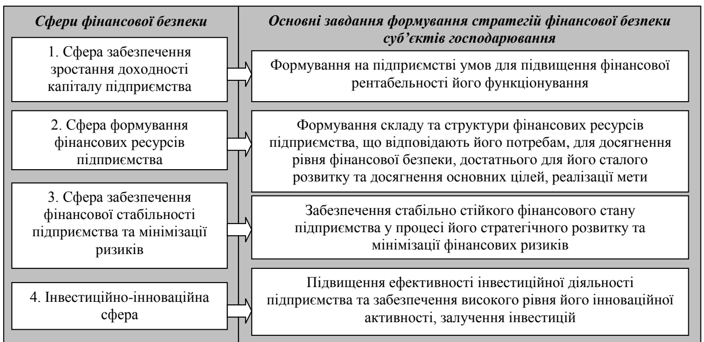
Рис. 1. Основні завдання формування стратегій фінансової безпеки суб'єктів господарювання для кожної її сфери

На основі узагальнення теоретичних положень уточнено визначення поняття стратегії ФБ підприємства, що сформульоване таким чином: стратегія ФБ підприємства являє собою один із видів функціональних стратегій підприємства, що забезпечує захист його фінансових інтересів від загроз внутрішнього та зовнішнього середовища шляхом формування довгострокових цілей, вибору шляхів їх досягнення у вигляді тактичних дій, адекватного коригування форм захисту при зміні впливу факторів фінансового середовища функціонування підприємства. Ґрунтуючись на запропонованому визначенні, проаналізовано практику діяльності промислових підприємств важкого машинобудування та виділено переважні сфери їх ФБ, основні завдання формування стратегій, що наведено на рис. 1.