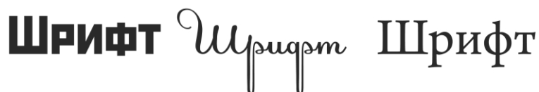
Рис. 2. Приклади шрифтових гарнітур

Визначте класи шрифтових гарнітур, наведених на рис. 2.