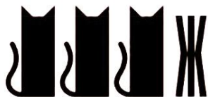
Рис. 3. Ребус