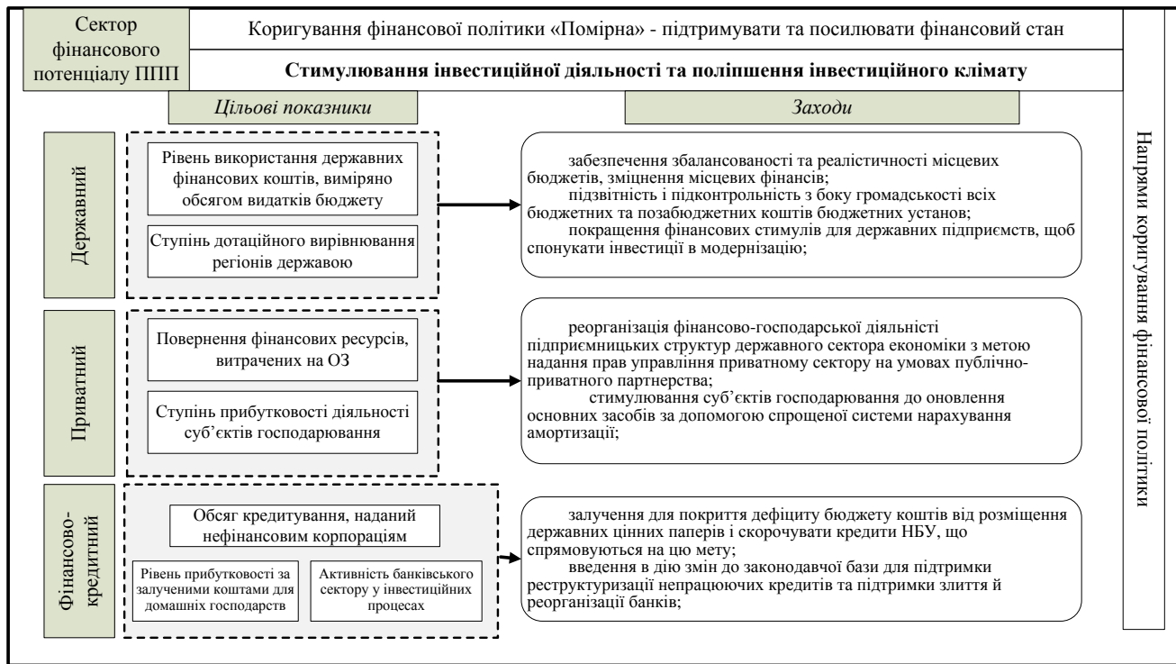
Рисунок 2. Напрями коригування помірною фінансової політики