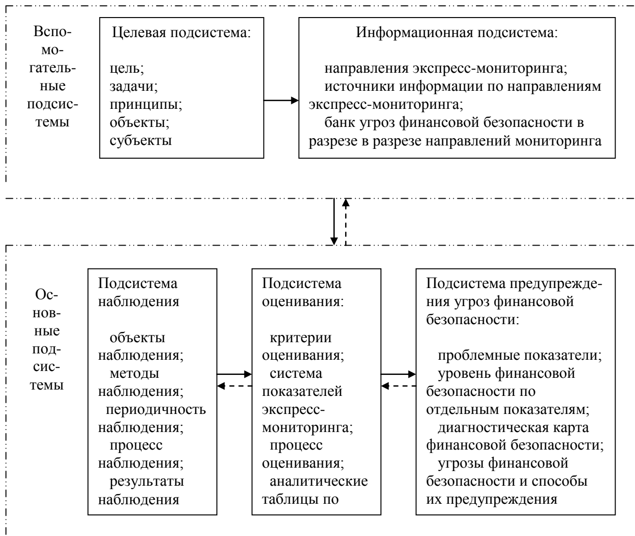
Рис. 2. Структура системы экспресс-мониторинга финансовой безопасности предприятия

По мнению авторов, система экспресс-мониторинга финансовой безопасности предприятия укрупнено состоит из трёх подсистем: наблюдения, оценивания и предупреждения угроз финансовой безопасности (рис. 2).