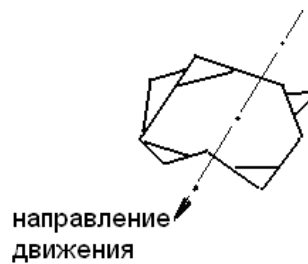
Рисунок 3 – Схема беспорядочного расположения выступов зерна

На процесс полирования оказывает значительное влияние размер абразивных зерен. Количество абразивных зерен, находящихся в зоне резания зависит от размера зерен. Давление полировальника на обрабатываемую поверхность распределяется на количество опорных точек, зависящих от размеров абразивных зерен. С уменьшением размеров абразивных зерен резко уменьшается давление, приходящееся на каждое зерно, что приводит к тому, что глубина внедрения выступов зерен резко уменьшается и количество перекатывающихся зерен (долевое участие) увеличивается. Фактический угол резания при этом будет большим, что и приведет к скольжению зерен по обрабатываемой поверхности. В процессе полирования наряду с основной массой абразивных зерен, выступающие элементы которых образуют большие отрицательные углы в процессе царапания, имеются отдельные зерна с выступающими частями, которые должны в процессе царапания образовывать положительные передние углы. По данным Ваксера Д. Б., острые углы составляют 20 – 25 % от их общего количества. Степень деформации металла в процессе царапания такими зернами должна быть значительно меньше. Однако, такие зерна больше подвержены дроблению в процессе полирования.