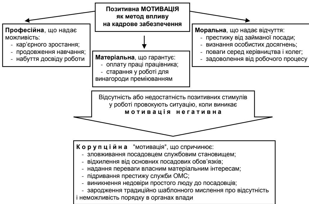
Рис. 2. Різноманітність мотиваційних ситуацій

Виходячи з наведеного вище, реальною можливістю для вирішення проблем кадрового забезпечення є створення мотивації позитивної і недопущення негативної. Позитивну мотивацію повинен втілити керівник, а також сам посадовець свідомо.