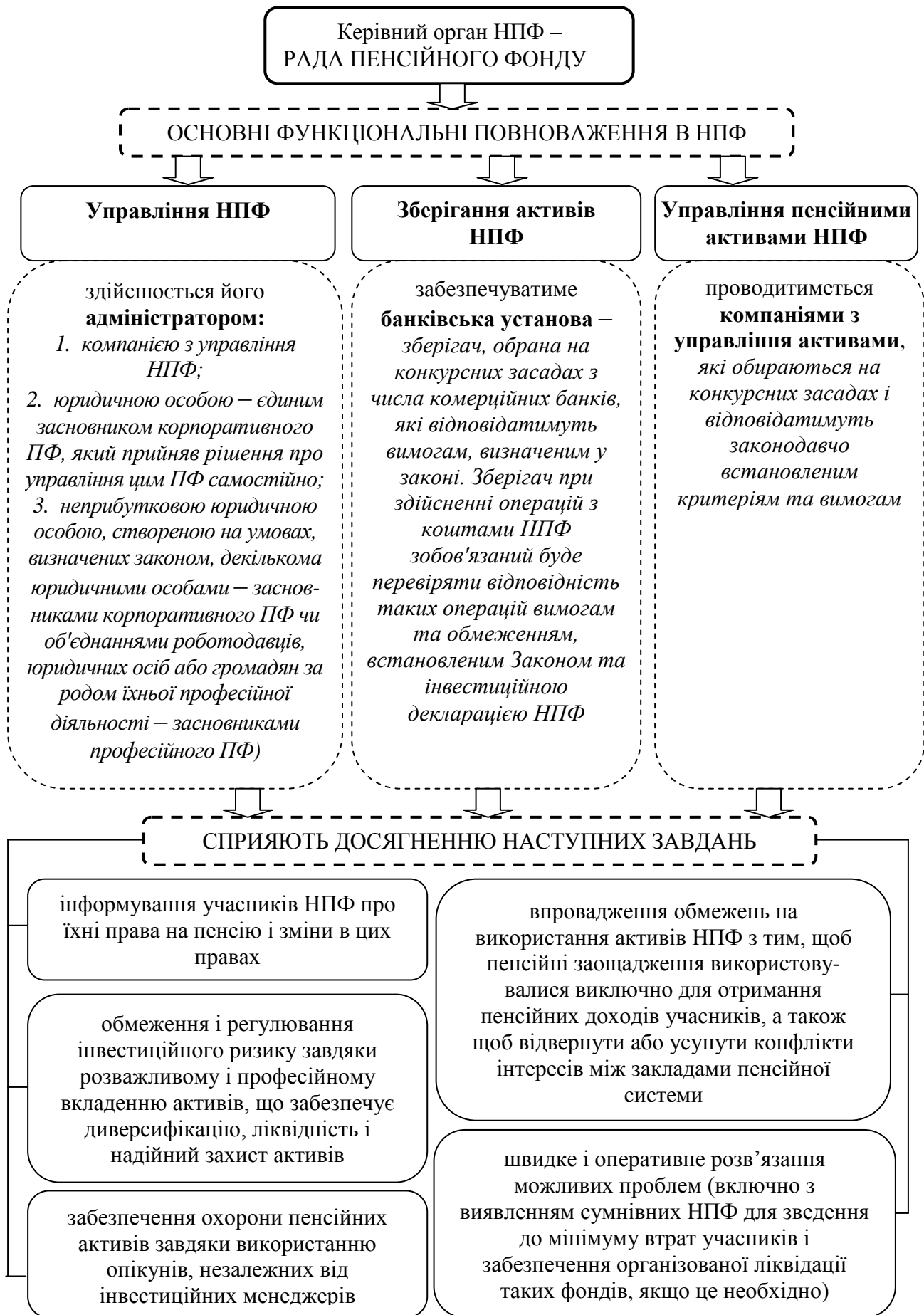
Рис. 4. Структура управління НПФ