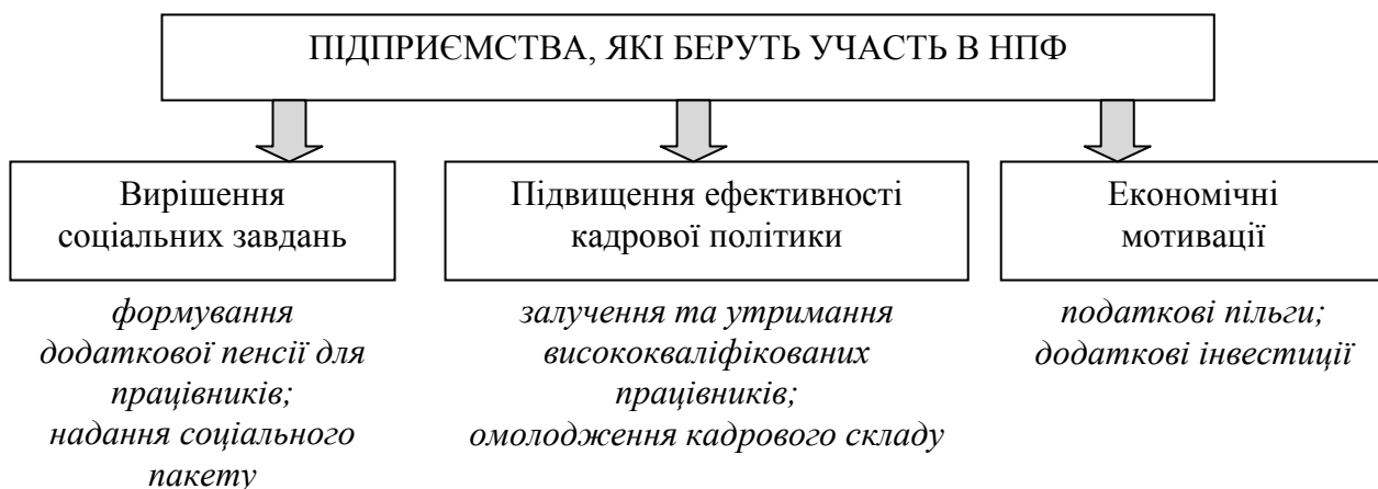
Рис. 5. Переваги участі підприємств в НПФ

Загалом, підприємства які приймають участь у НПФ отримують переваги, наведені на рис. 5.