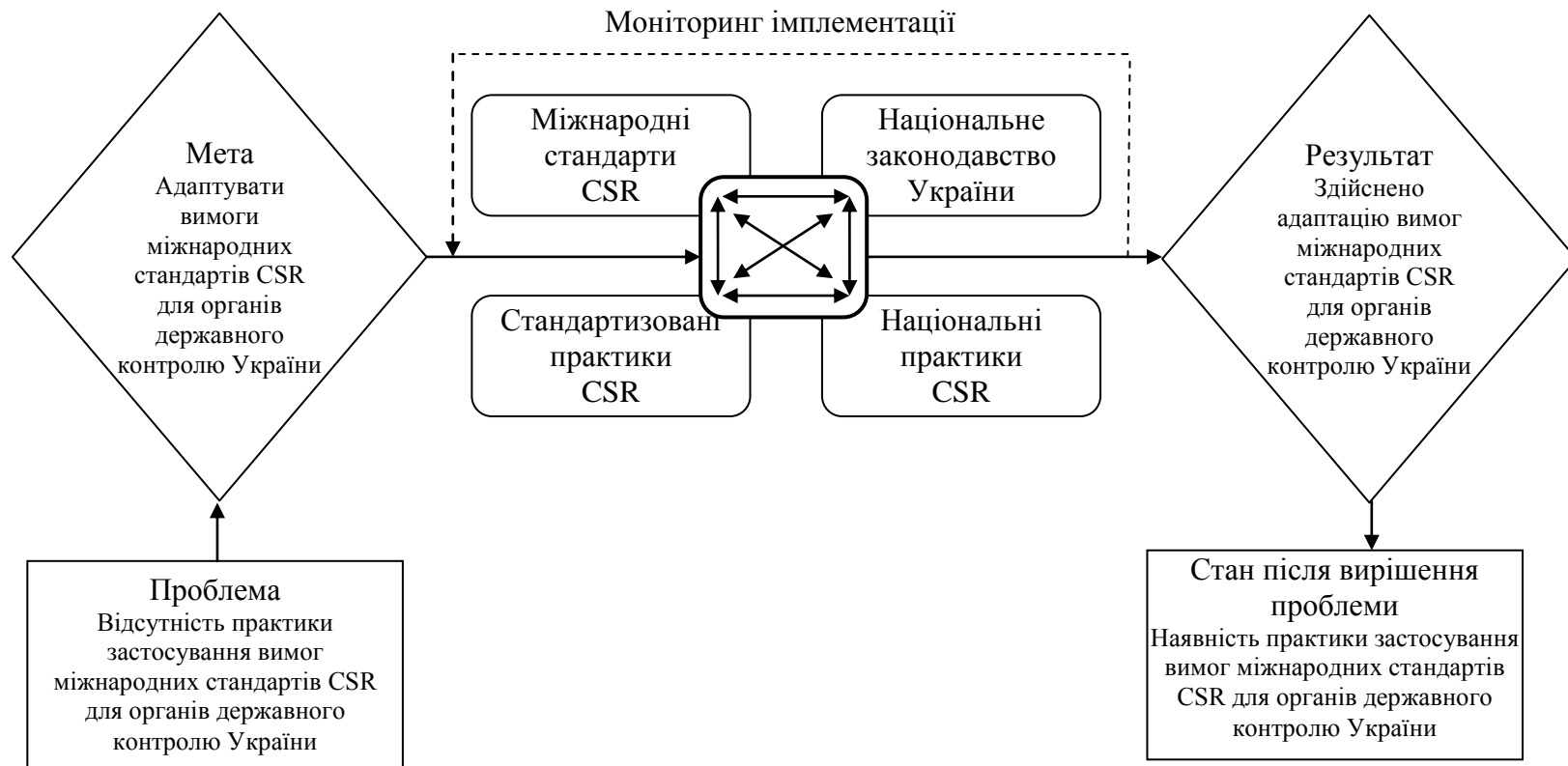
Рис. 1. Системна модель механізму адаптації вимог міжнародних стандартів корпоративної соціальної відповідальності для застосування в органах державного контролю України (Т. Маматова [7])