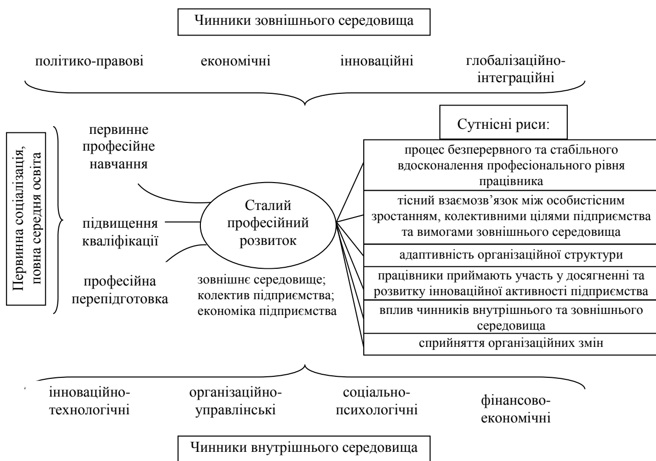
Рис. 2. Взаємозв'язок системи професійного навчання та сталого професійного розвитку працівників

для постійного підвищення майстерності та професіоналізму працівників, переформатування їх професійної спрямованості у відповідь на виклики зовнішнього середовища та відповідно до стратегії підприємства тощо. В цьому контексті слід визначити положення концепції навчання протягом життя, яка в межах даного взаємозв'язку відіграє роль певного поєднувального матеріалу між викликами сьогодення й ситуацією на підприємстві як та, що передбачає створення умов, мотивів, показників, базису для навчання. Таким чином, простежується певна послідовність між необхідністю формування компетентностей працівників та створенням сталого професійного розвитку із відповідним набором сутнісних рис, що у взаємодії приносить суспільно корисний результат у вигляді ефективно діючого підприємства, яке здатне реагувати на виклики сьогодення шляхом швидкого переформатування кадрової політики.