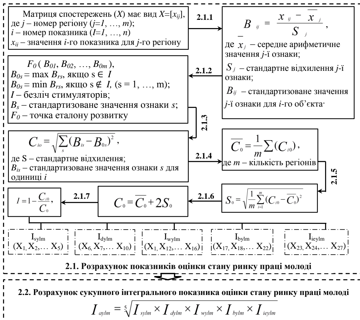
Рис. 2 . Деталізація етапу розрахунок часткових інтегральних показників та сукупного інтегрального показника оцінки стану ринку праці молоді [17; 18; 19; 20]

Для дослідження розглянутих багатовимірних об'єктів пропонується використовувати таксономічний показник, що представляє собою синтетичну величину всіх ознак, що характеризують одиниці досліджуваної сукупності. Деталізація етапу розрахунок часткових інтегральних показників та сукупного інтегрального показника оцінки стану ринку праці молоді запропонованого методичного підходу подано на рис. 2.