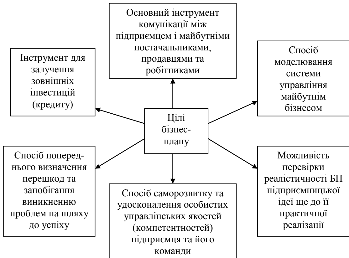
Рисунок 1 - Основні цілі бізнес-плану [на основі 1, 2, 11]

6. визначити реальність та практичну здійсненність підприємницької ідеї та економічну доцільність або економічну недоцільність реалістичності запропонованого у бізнес-плані для конкретного суб'єкту господарювання.