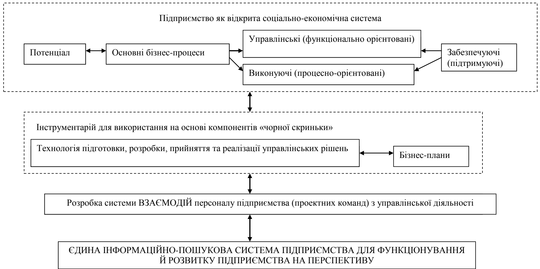
Рисунок 3 - Рекомендований системно-комплексний підхід до розробки взаємодій персоналу підприємства