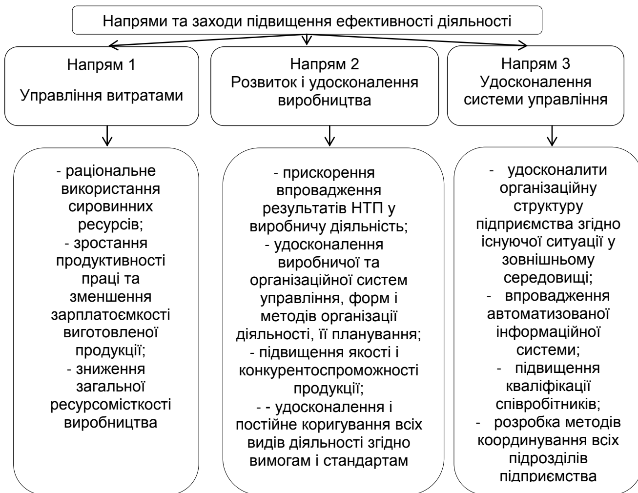
Рис. 2 Напрями та заходи підвищення ефективності діяльності підприємств [7]

Слід зазначити, що досягнення певного рівня успішності функціонування підприємства невідомо пов'язане з набуттям підприємством ознак конкурентоспроможності. Ринкове середовище вимагає від підприємства постійного вдосконалення.