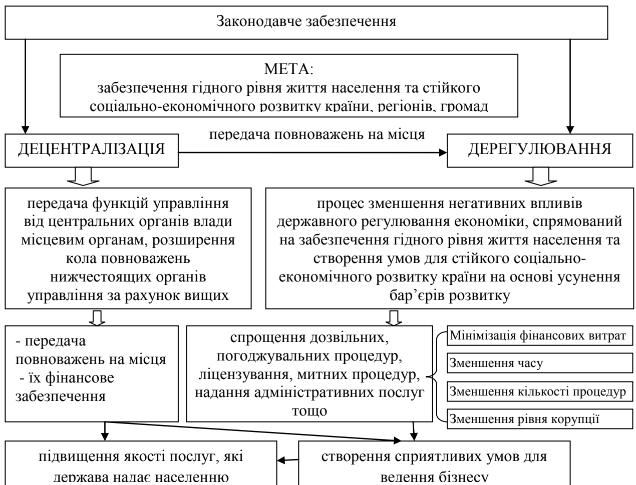
Рис. 1. Взаємозв'язок дерегулювання та децентралізації економіки

Дерегуляційні процеси в бюджетній сфері безпосередньо пов'язані з реформою децентралізації влади, що передбачає розширення свобод і усунення бар'єрів для саморозвитку територіальних громад, районів і регіонів і підприємницької діяльності (рис. 1).