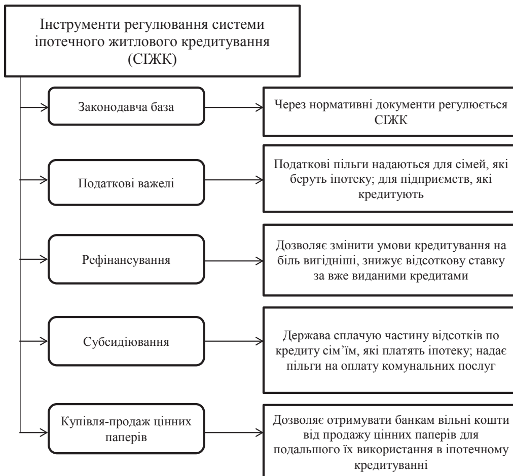
Рис. 1. Інструменти регулювання СІЖК

Також однією з ефективних схем стимулювання іпотеки в країнах Європи є програма субсидіювання. При цьому є різні схеми дотації. Так в Німеччині, Греції та Іспанії для сімей, які придбали житло в кредит, діють податкові пільги на доходи, отримані у вигляді заробіт-