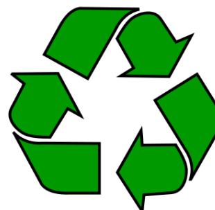
Рис. 2. Стрічка Мебіуса

Ідея рециклінгу своїм корінням йде в далеке минуле, але безпосереднє поширення набула відносно недавно. В сфері технологій переробки вторинної сировини лідирують Німеччина, США, Нідерланди, Франція, Швейцарія, Росія на даний час втратила свої позиції. Міжнародним символом рециклінгу прийнято вважати стрічку Мебіуса (рис. 2).