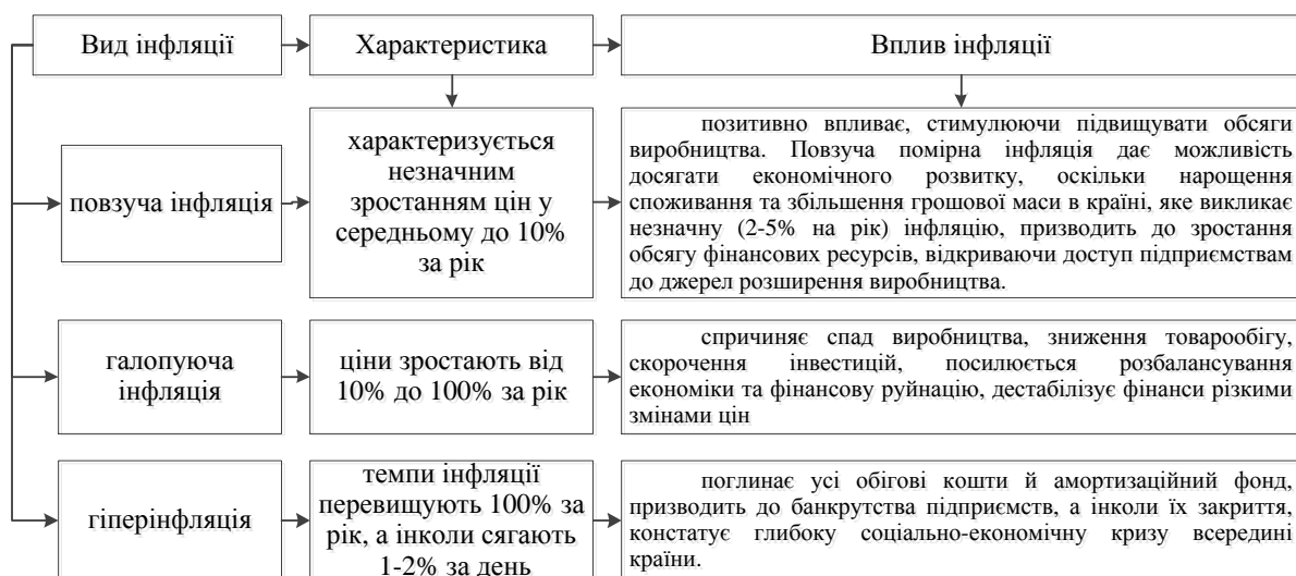
Рис. 4. Вплив інфляції в розрізі окремих її видів

Слід розглядати вплив інфляції в розрізі окремих її видів (рис. 4) [10].