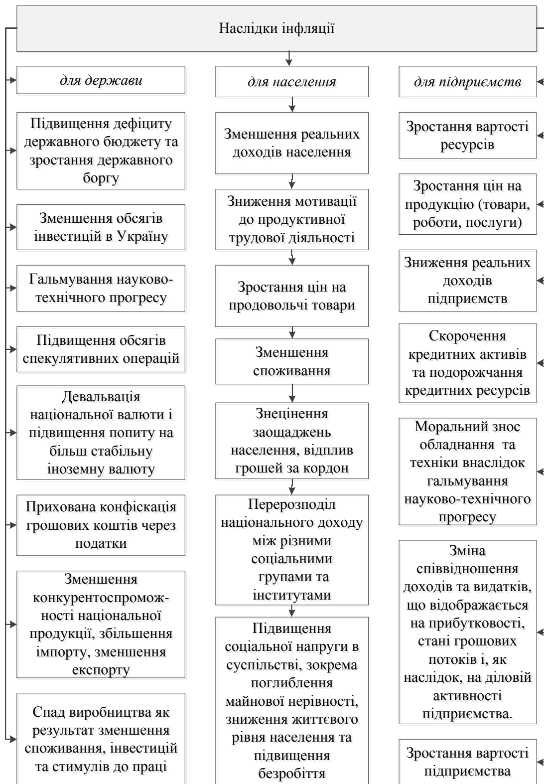
Рис. 1. Наслідки інфляції для держави, населення та підприємств

На зростання цін на сільськогосподарську продукцію впливають як інфляційні процеси, так і не інфляційні (рис. 2).