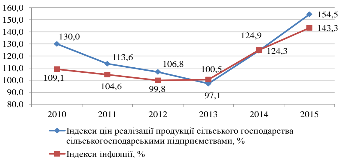
Рис. 3. Динаміка індексів цін реалізації продукції сільськогосподарськими підприємствами та індексів інфляції [14, 15, 16]

Динаміка індексів цін реалізації продукції сільського господарства сільськогосподарськими підприємствами та індексів інфляції представлено на рис. 3.