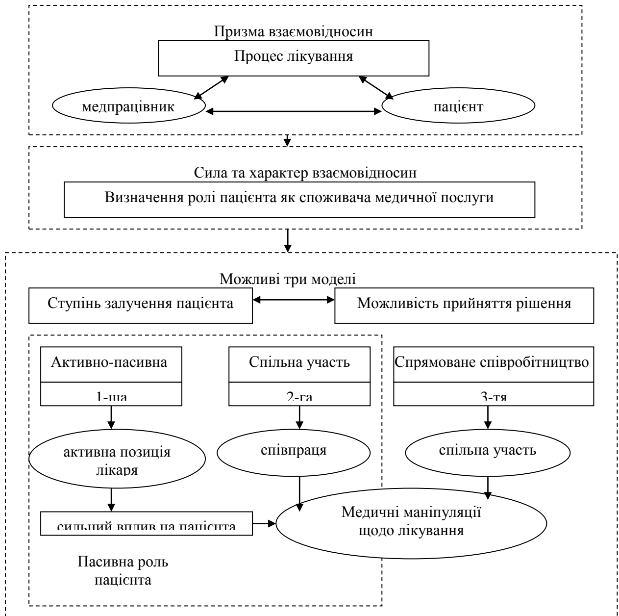
Рис. 3. Участь пацієнта у лікувальному процесі [на основі 16]

Третій напрямок дослідження спрямовано на систему взаємовідносин, взаємообумовленостей та взаємозв'язків лікаря-пацієнта різної направленості. Взаємовідносини лікаря і пацієнта відображено на рис. 3.