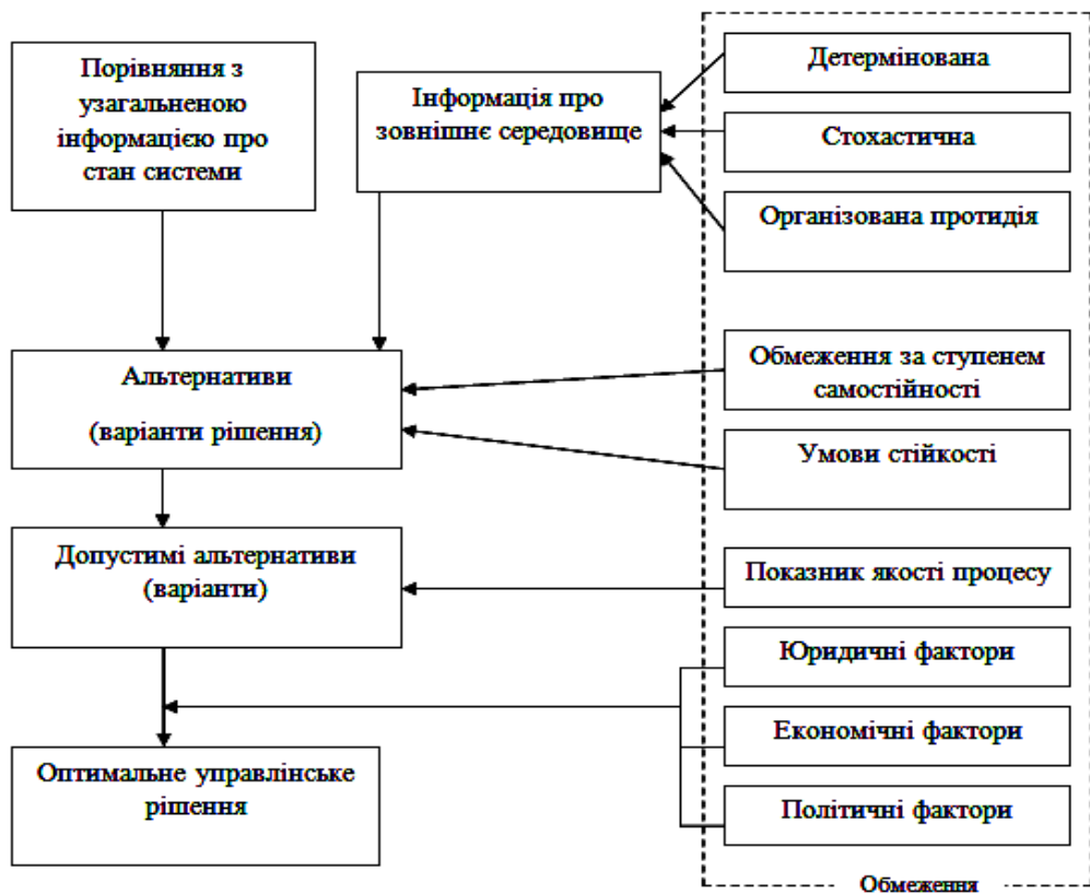
Рис. 1. Модель процесу прийняття антикризового управлінського рішення

Коротков Е. М. [2] пропонує модель розробки управлінських рішень в антикризовому управлінні (рис. 2). Дана технологія включає в себе основні етапи розробки управлінських рішень, а саме: збір інформації, аналіз кризової ситуації, визначення доцільності антикризового управління.