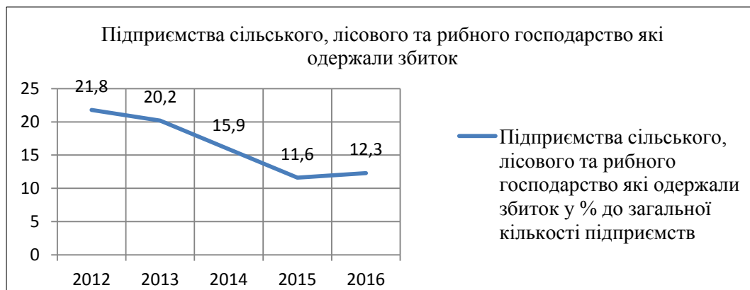
Рис.2 Чистий збиток підприємств за видами економічної діяльності [2]

Проведемо аналіз збитковості підприємств сільського, лісового та рибного господарства. Результат дослідження представлений на рисунку 2.