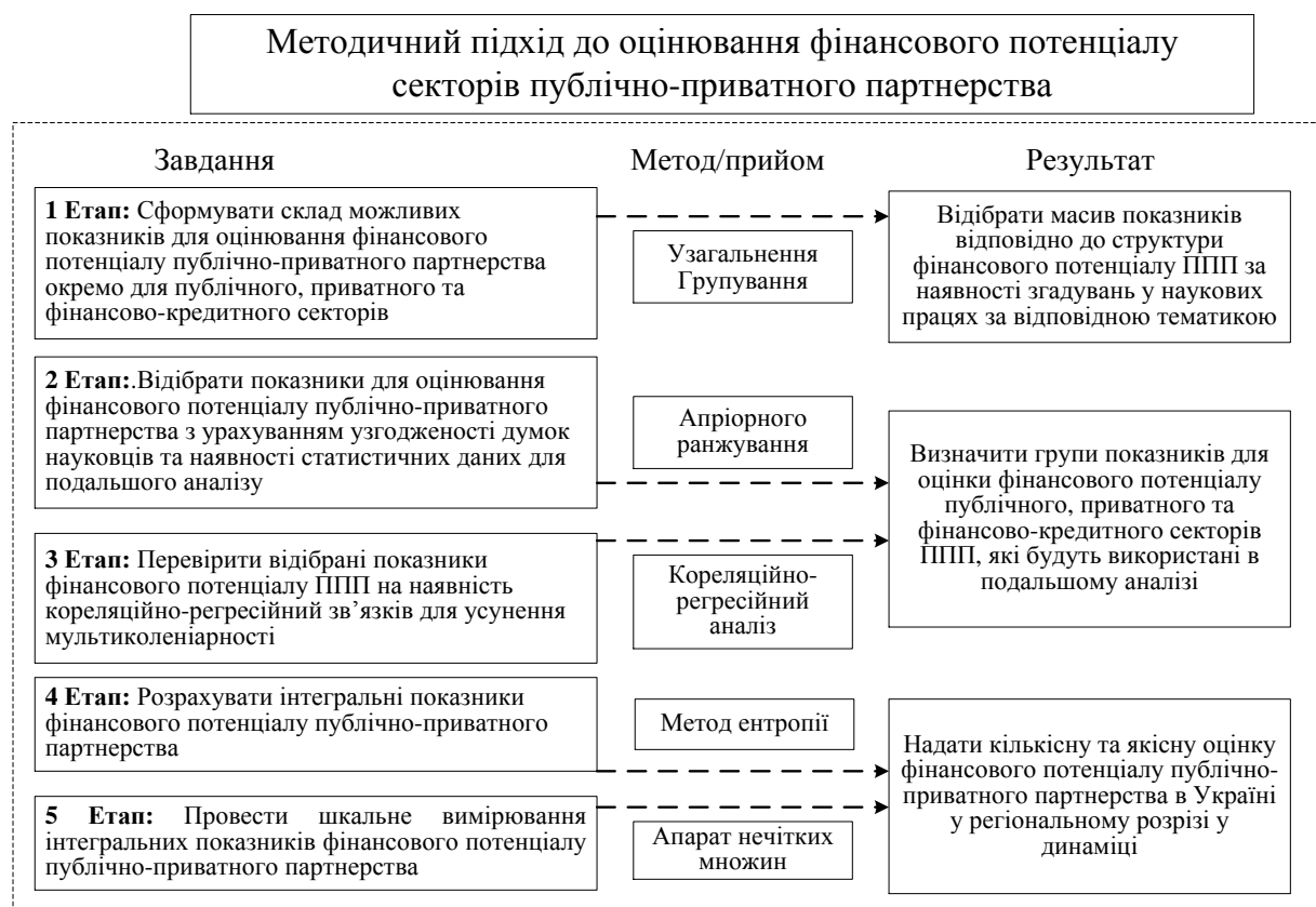
Рис. 2. Методичний підхід до оцінювання фінансового потенціалу публічно-приватного партнерства

Запропоновано методичний підхід до оцінювання фінансового потенціалу публічно-приватного партнерства (рис. 2), що передбачає отримання кількісної та якісної оцінки фінансового потенціалу публічного, приватного та фінансово-кредитного секторів ППП, що дозволяє визначити наявні фінансові можливості учасників публічно-приватного партнерства.