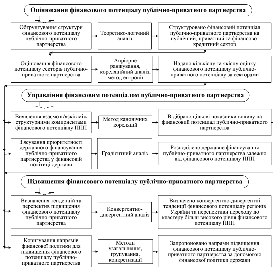
Рис. 1. Послідовність формування фінансового потенціалу публічно-приватного партнерства

Запропоновано послідовність формування фінансового потенціалу публічно-приватного партнерства (рис. 1), що дозволяє оцінити фінансовий потенціал ППП у розрізі його структурних елементів, забезпечити оптимальне структурування державної підтримки для фінансування публічно-приватного партнерства, підвищити потенційну можливість взаємодії держави та приватного сектору за рахунок визначення проблем, перспектив та напрямів їх коригування.