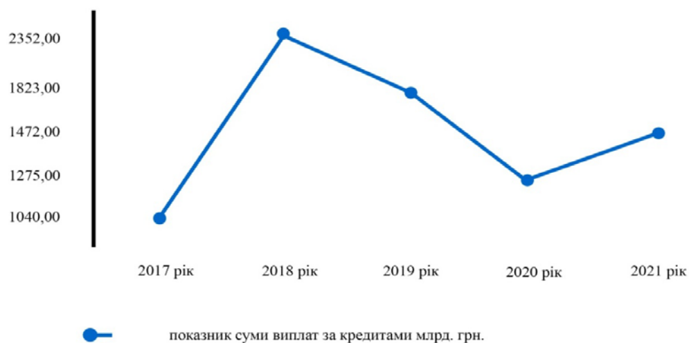
Рис. 2. Сума виплат за кредитами України за 2017 – 2021 рр., млрд. грн.

Крім того ситуація погіршується тим, що наступними роками сума виплат за кредитами є досить значною (рис 2) .