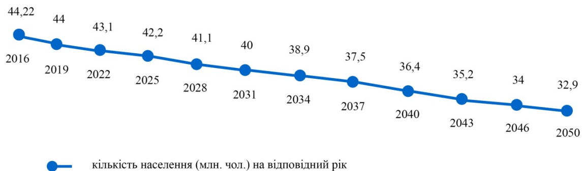
Рис. 1. Прогноз чисельності населення України за умови незмінних показників народжуваності, тривалості життя та міграції.

Більшість розвинених країн світу також мають наступні проблеми, однак вони у будь-якому випадку частково вирішуються за рахунок зовнішньої міграції. Наприклад, Росія є однією із країн з середнім рівнем економічного розвитку і має природне перевищення смертності над народжуваністю, тобто за рахунок власних громадян відбувається зниження чисельності населення, однак в цілому, у зв'язку із зовнішньою міграцією населення хоча б і незначним чином але збільшується (на період 2016-2017 збільшення відбулося на 267 000).