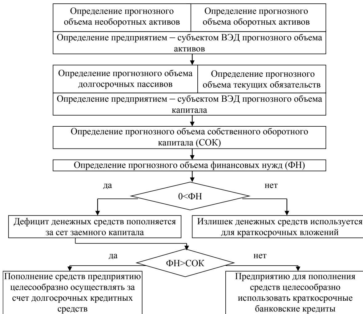
Рис. 2. Алгоритм расчета оптимальной потребности предприятия – субъекта ВЭД в кредитных средствах

Шестым этапом представленной нами политики привлечения кредитных ресурсов является оценка предприятием – субъектом ВЭД собственной кредитоспособности. Следует отметить, что кредитоспособность характеризует рискованность финансового состояния предприятия с точки зрения предпосылок для получения кредита. Поэтому предварительно установленный уровень кредитоспособности дает