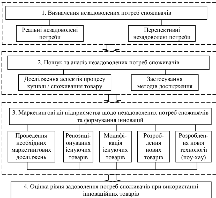
Рис. 1. Стратегічна модель маркетингового управління інноваціями

Ефективність маркетингового управління інноваціями в міжнародному бізнесі досягається за умов розробки стратегії, підкріпленої ефективним комплексом маркетингових засобів. З огляду на це, нами запропонована стратегічна модель маркетингового управління інноваціями, яка включає визначення незадоволених потреб споживачів, їх пошук та аналіз, маркетингові дії підприємства щодо незадоволених потреб та формування інновацій, оцінку рівня задоволення потреб споживачів при використанні інноваційних товарів (рис. 1).