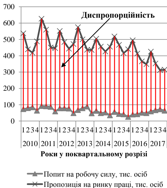
Рис. 2. Попит і пропозиція робочої сили на зареєстрованому ринку праці

Також доцільно відмітити сезонний характер зрушень на ринку праці. Так, найбільш незбалансованими щорічно є 1 - 2 квартали, тоді як дещо зрівноважити попит та пропозицію на робочу силу стає можливим у 4 кварталі. Це можна пояснити тим, що за професійними групами найбільший попит роботодавців припадає на кваліфікованих робітників з інструментом та на робітників з обслуговування, експлуатації устаткування. Також затребувані працівники сфери послуг. У сільськогосподарському секторі – трактористи, агрономи, робітники з обслуговування сільськогосподарського виробництва, птахівники та лісоруби. Доцільно зазначити, що для більшості цих професій характерною є сезонність праці.