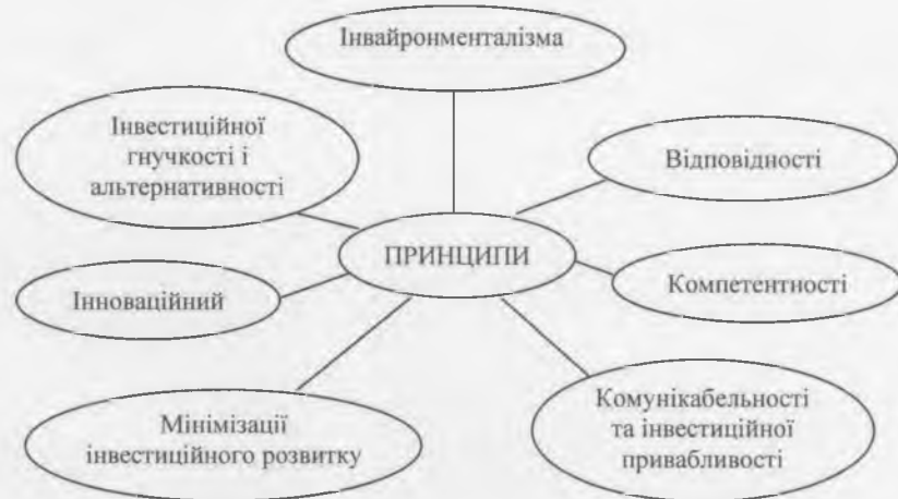
Рисунок 1 – Принципи нової управлінської парадигми - системи стратегічного управління.

– принцип окупності. Сутність принципу окупності полягає в тому, що інвестиції повинні приносити певний економічний ефект, а отже інвестор повинен бути впевнений, що вони принесуть прибуток а не збиток. В разі, якщо інвестор отримає збиток то це означатиме, що інвестиційна стратегія є неефективною для даного об'єкта інвестування. Інвестиційна стратегія обов'язково повинна приносити економічні результати, тобто бути окупною.