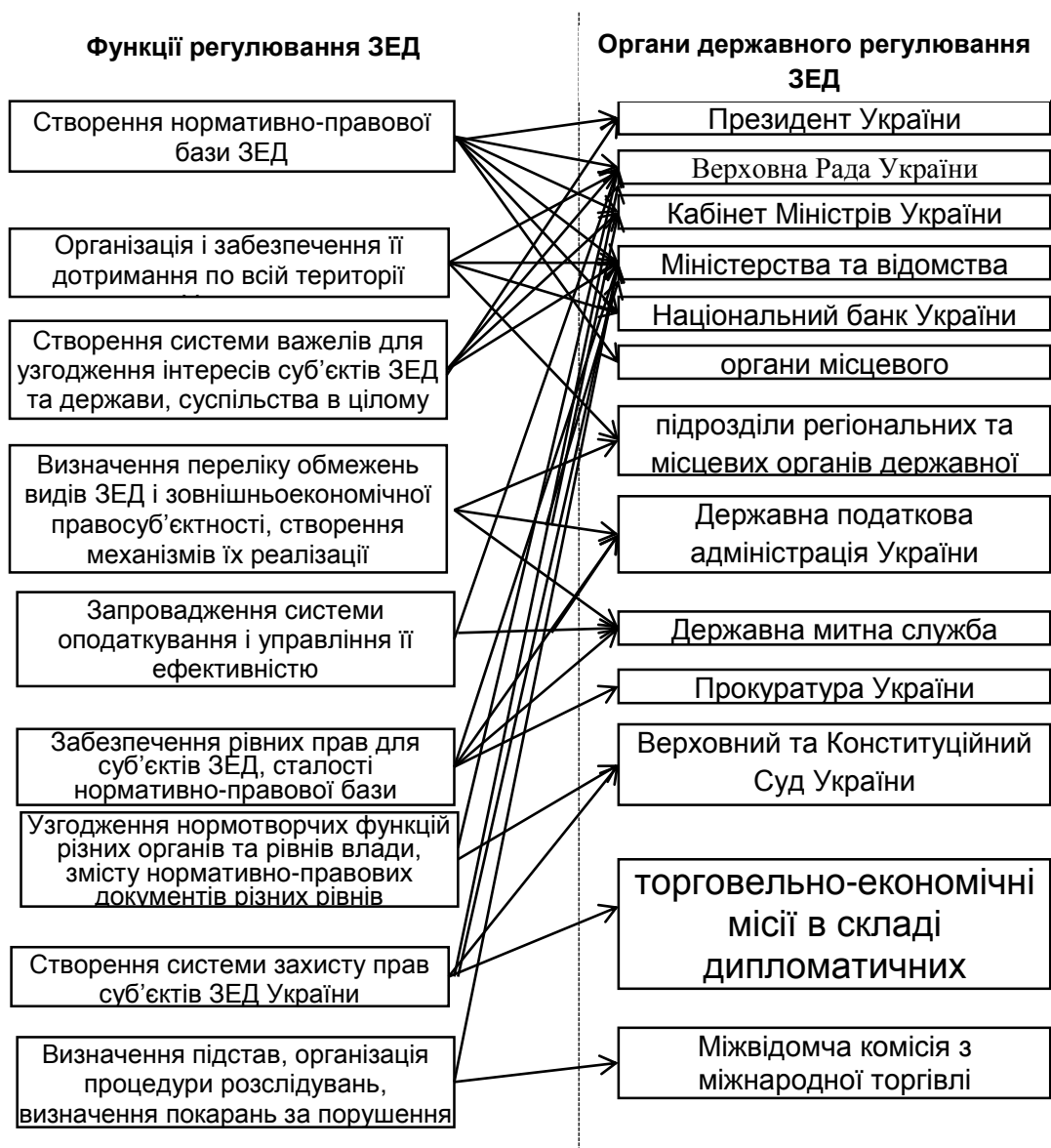
Рис. 2. Функції державного регулювання зовнішньоекономічної діяльності органами державного регулювання ЗЕД

Головною метою фінансового механізму є обслуговування та підтримка всіх видів зовнішньоекономічної діяльності, тобто даний механізм є потужним інструментом провадження фінансової політики держави, який є важливим не тільки для держави, а й для суб'єктів підприємницької діяльності за рахунок створення позитивного іміджу країни та поповнення валютних резервів, що дозволяє суб'єктам господарювання більш раціонально використовувати економічний потенціал, отримувати доступ до нових технологій, завойовувати нові ринки збуту продукції. При комплексному аналізі зовнішньоекономічної діяльності охоплюється вся взаємопов'язана сукупність показників, що відображають повністю або частково господарську, виробничо-комерційну й фінансову діяльність суб'єктів господарювання щодо реалізації зовнішньоекономічних відносин. Враховуючи такі методологічні передумови, важливо проаналізувати особливості фінансового механізму ЗЕД з урахуванням його складових, а саме: механізму митно-тарифного регулювання ЗЕД, валютно-фінансового механізму,