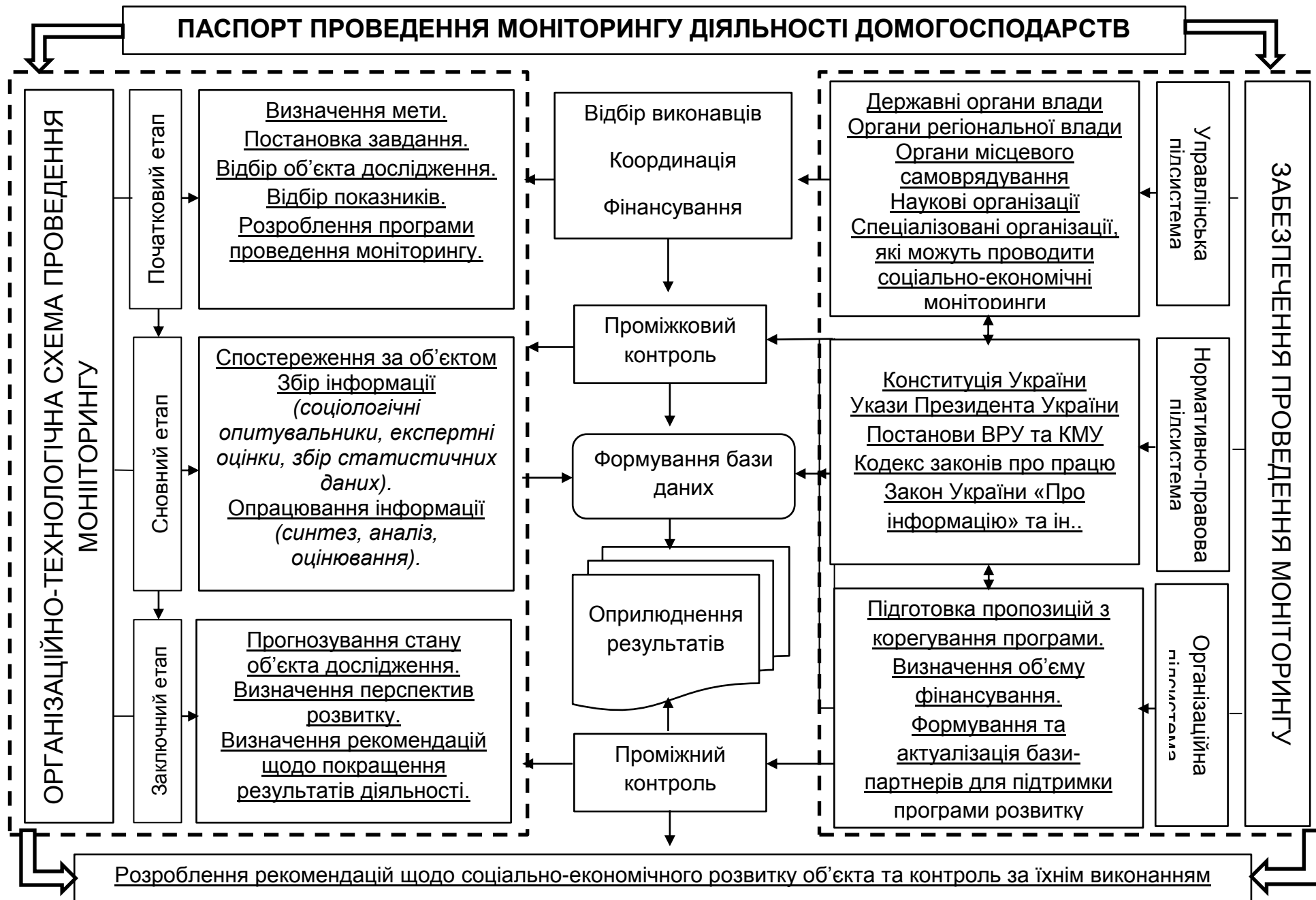
Рис. 1 Паспорт проведення моніторингу соціально-економічної діяльності домогосподарств