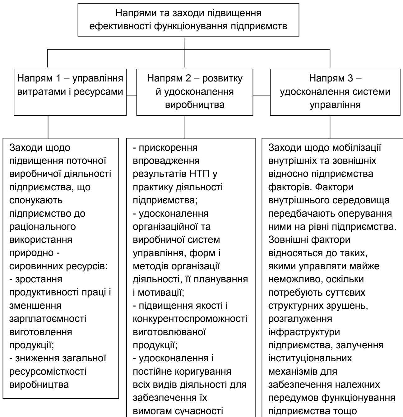
Рис. 1. Напрями підвищення ефективності роботи підприємств

Як бачимо з рис.1, усі заходи підвищення ефективності роботи підприємства є взаємозалежними. Однак, найважливішого значення набувають чинники, визначені третьою групою (напрямом), оскільки їх мобілізація передбачає визначення місця реалізації в системі управління діяльністю [1, с. 469-470].