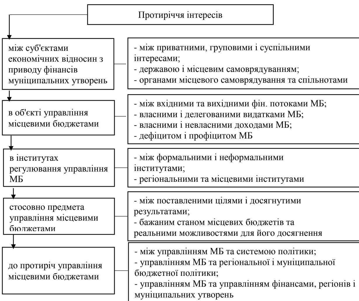
Рис. 1. Протиріччя інтересів відносно управління місцевими бюджетами

В області управління фінансами муніципальних утворень можна виділити в якості носіїв фінансових інтересів держава, місцеве самоврядування, бюрократію і різні групи, а також індивідів. Наявність безлічі носіїв інтересів обумовлює існування протиріч між їх приватними, груповими і суспільними інтересами. Ці протиріччя втілюються в процесі руху інтересів різних суб'єктів (рис 1).