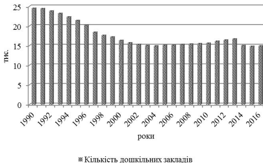
Рис. 1 Кількість дошкільних навчальних закладів за 1990 – 2016 рр.

За часи незалежності України кількість дошкільних навчальних закладів поступово зменшувалася (рис. 1).