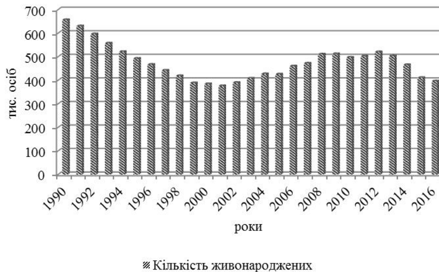
Рис. 2 Кількість живонароджених у 1990 – 2016 рр.

обумовлений впливом об'єктивних факторів: становлення незалежної держави, складна економічна та соціальна ситуація, і як наслідок зниження народжуваності (рис. 2).