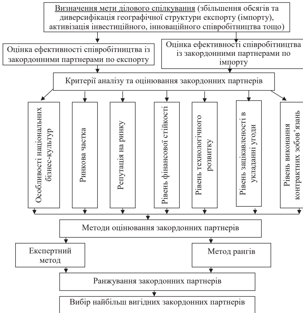
Рис. 2. Запропонована послідовність вибору закордонних партнерів для українських підприємств

рівень інформаційного забезпечення; рівень підготовки до переговорів; рівень емоційності під час проведення переговорів; тривалість проведення переговорів; готовність до консенсусу; орієнтація на прибуток як на кінцеву мету укладання угоди для потенційного партнера та його готовність йти на ризик під час її реалізації для досягнення економічного результату. Автором пропонується проводити оцінювання з використанням експертного методу за десятибальною шкалою, в якій мінімальний бал (0–3) свідчить про низький рівень, 4–7 – про середній рівень, а максимальний (8–10) – про високий рівень значення цього критерія.