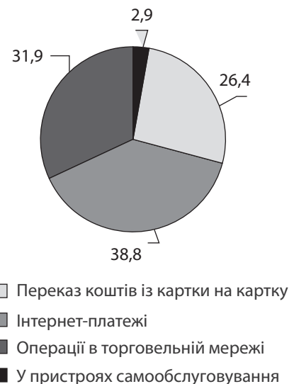
Рис. 2. Структура безготівкових операцій в Україні станом на кінець 2017 р., %

Фішинг – це розповсюджений вид Інтернет-шахрайства, який передбачає розсилку повідомлень на e-mail про значний виграш, при цьому для його отримання необхідно вказати номер і CVV2/CVC2 код картки. Зрозуміло, що ніякого виграшу людина,