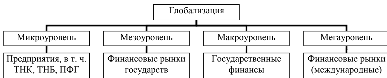
Рис.1. Влияние глобализации на различные уровни развития общественных экономических отношений

взаимозависимости национальных экономик, оказывающий влияние на все сферы жизнедеятельности общества (рис.1) [2, 4].