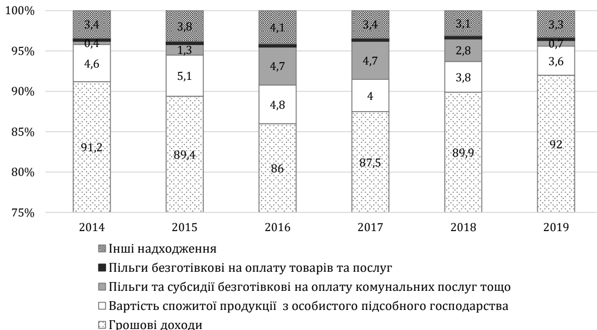
Рис. 2. Структура джерел доходів домогосподарств (за даними [6])

наданих готівкою; грошової допомоги від родичів, інших осіб та інші грошові доходи. Іншими джерелами доходів домогосподарств є вартість спожитої продукції, отриманої з особистого підсобного господарства та від самозаготівлі; безготівкові пільги та субсидії на оплату житлово-комунальних послуг, електроенергії, палива; безготівкові пільги на оплату товарів та послуг з охорони здоров'я, туристичних послуг, путівок на бази відпочинку тощо, на оплату послуг транспорту, зв'язку та інші надходження. Структура джерел доходів домогосподарств в цілому по Україні за 2014-2019 рр. наведена на рис. 2.