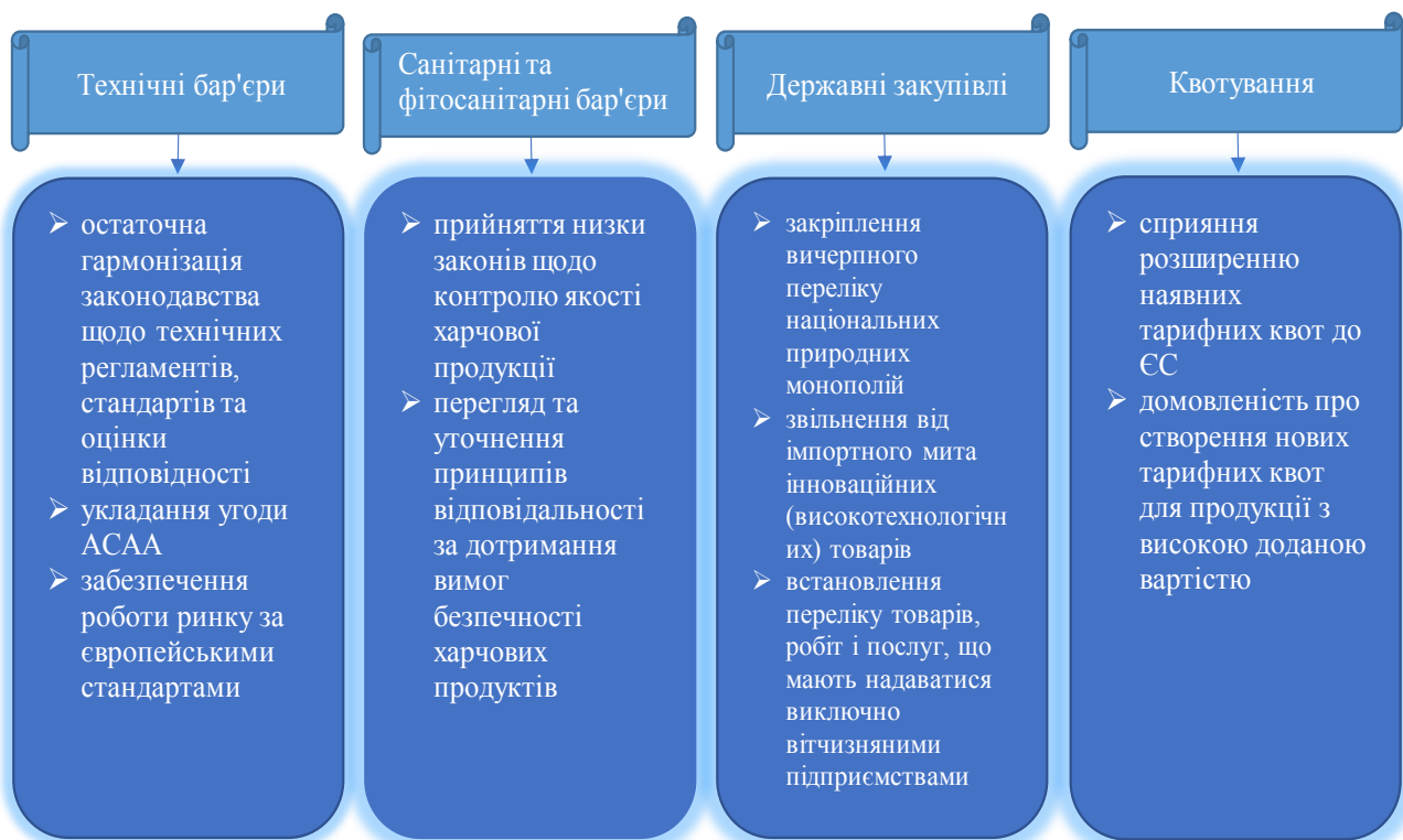
Рис. 3. Заходи з реформування системи нетарифного регулювання зовнішньої торгівлі України