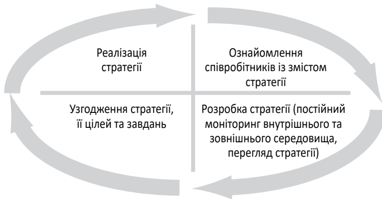
Рис. 1. Процес стратегічного планування підприємства

Доцільно виділити такі особливості процесу стратегічного планування підприємства [4]: компанія розглядається як цілісна система, її структурні підрозділи є взаємопов'язані та взаємодіючі елементи цієї системи; акцент на довгостроковій перспективі; акцентування уваги на вирішенні ключових проблем компанії; активізація взаємодії управлінського персоналу з розвитку компанії надалі. На рис. 1 наведено процес стратегічного планування підприємства.