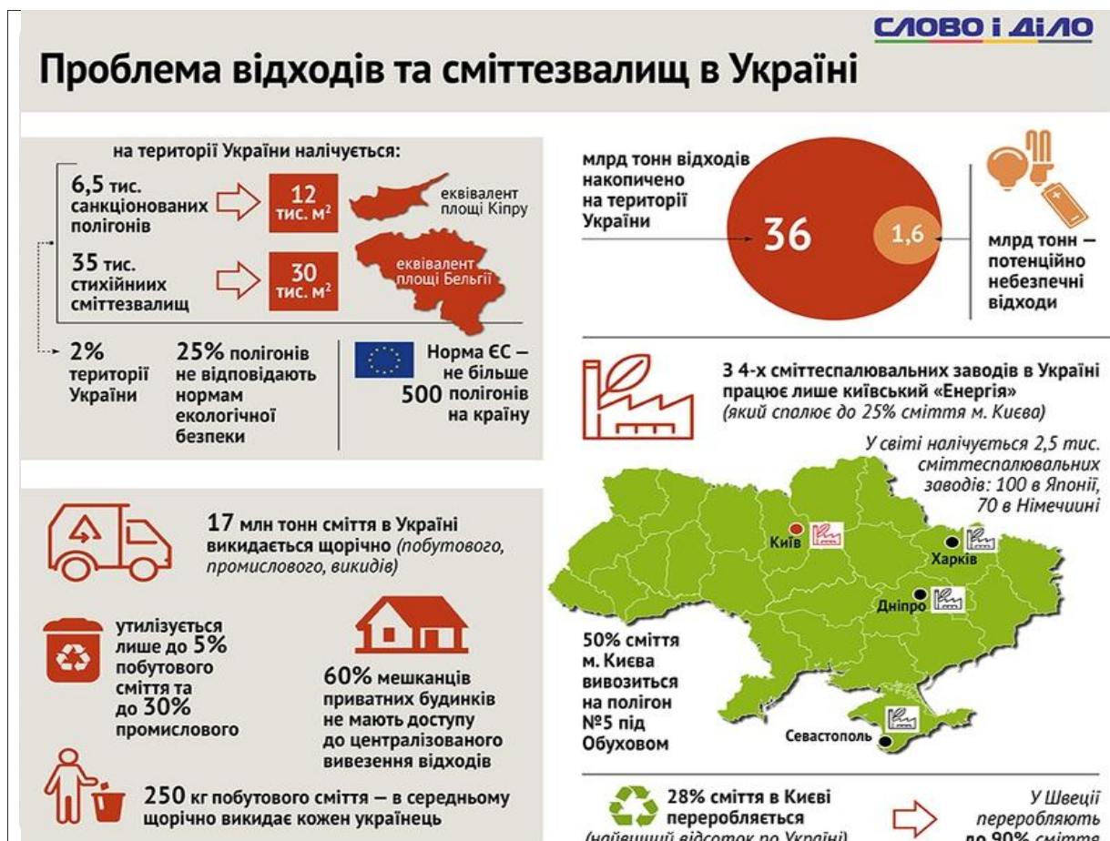
Рис. 1. Бланк 1 для виконання завдання вправи "Вирішення конфліктів"

Процедура. Слухачі отримують бланк 1 (рис. 1).