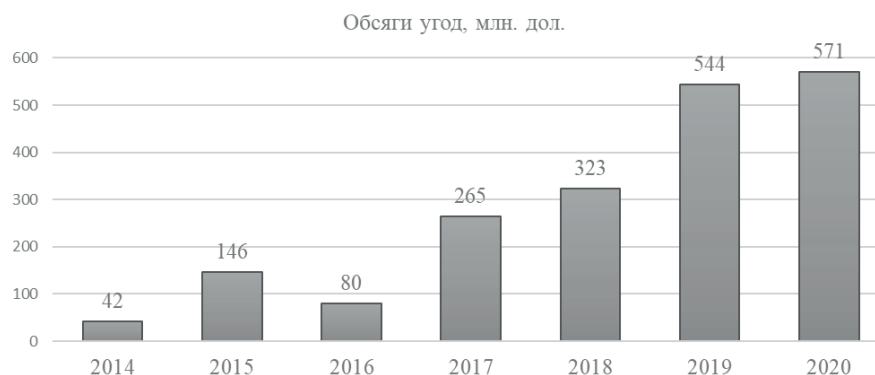
Рис. 1. Динаміка обсягів інвестицій у вітчизняні стартапи, млн. дол [10]

Зокрема, у 2021 році у даному заході прийняли участь представники з різних країн, де фіналісти були представлені з таких як Польща, Румунія, Греція, Кіпр, Хорватія, Італія, Іспанія, Угорщина, Ірландія, Україна та Бельгія, що презентували свої стартапи у 18 категоріях [12]. За категорією «Туризм» першість обійняв «Live Electric Tours», який також був переможцем «Найкращий стартап у світі» у категорії «Sustainability» у заході «Tourism Startup Competition», що організовувався ЮНВТО.