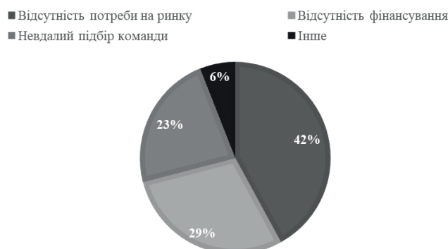
Рис. 3. Причини невдач серед стартапів, % [23]

Попри значну кількість стартапів, які з кожним роком збільшуються, існує низка проблем з їх подальшою реалізацією. Зокрема, майже 90% стартапів стають неуспішними через 3 ключові проблеми (рис. 3).