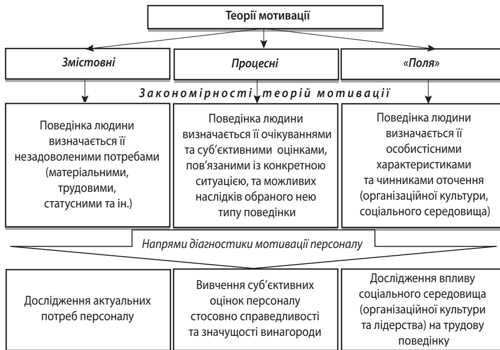
Рис. 1. Напрями діагностики мотивації працівників відповідно до сучасних теорій мотивації