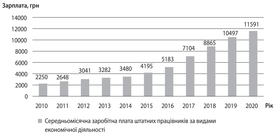
Рис. 3. Динаміка середньомісячної зарплатної плати в Україні, грн