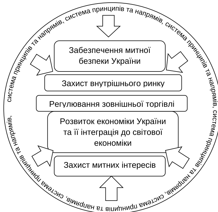
Рис. 1. Графічне зображення визначення «державна митна політика»

Як видно з наведеного поняття, під час реалізації митної політики використовуються механізми тарифного та нетарифного регулювання, що включають інструменти у вигляді митних платежів. Також прописано, що митна справа є відповідальною за правильність нарахування та сплати таких платежів.