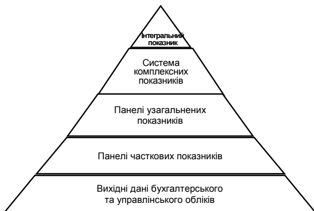
Рис. 1. Піраміда структуризації показників

Увесь процес одержання комплексного показника називається оцінюванням, а результат процесу – оцінкою. Для формування загальносистемного критерію ефективності, який потрібен для координації та загальної оптимізації господарської діяльності, здійснюється згортання комплексних показників в один інтегральний. Операція консолідації складається з вибору типу згортання, вибору моделі комплексного показника та визначення коефіцієнтів значимості часткових показників.