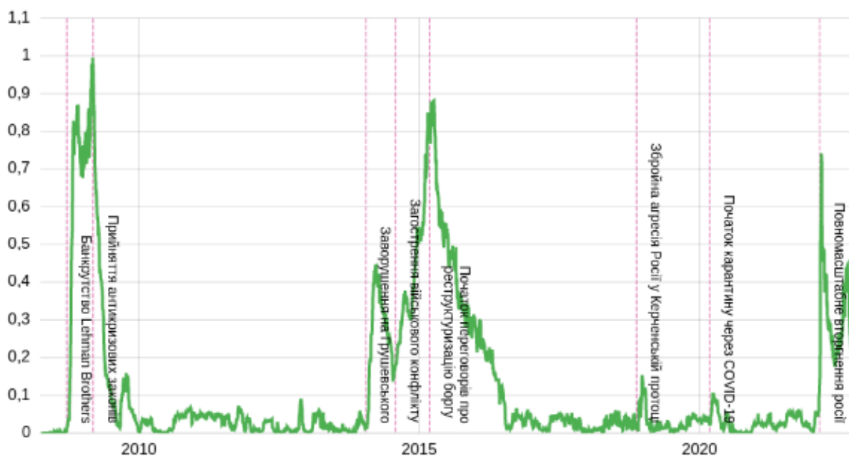
Рис. 3. Динаміка Індексу фінансового стресу [10]

На графіку (рис. 3.) зображені ключові події, що впливали на фінансовий ринок України. Зокрема, невдовзі після банкрутства Lehman Brothers зафіксовано пікове значення ІФС. Наступне стрімке зростання ІФС під час кризи 2014-2015 років хоча й нижче рівнем, але значно триваліше за часом.